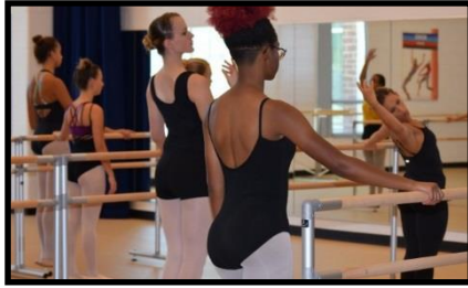
Amplio estudio de danza contemporánea.