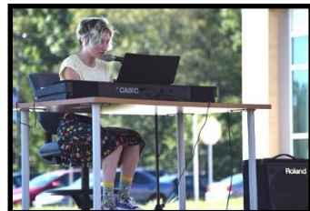
Representaciones de los estudiantes en el anfiteatro al aire libre durante los almuerzos.

** En el penúltimo y último año de secundaria, los estudiantes de música instrumental y vocal pueden optar por tomar Tecnología Musical y Tecnología Musical Avanzada en reemplazo o en adición a las clases de música de nivel superior.