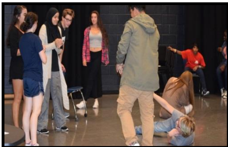
Caja negra deliberadamente diseñada para permitir pequeñas actuaciones y apoyar así la creatividad de los estudiantes.