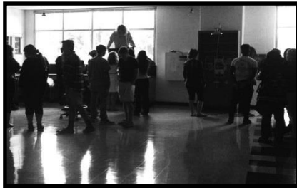
Estudiantes de artes visuales y fotografía inmersos en el proceso de crear una cámara oscura para una comprensión práctica de la función de una cámara réflex de 35mm.