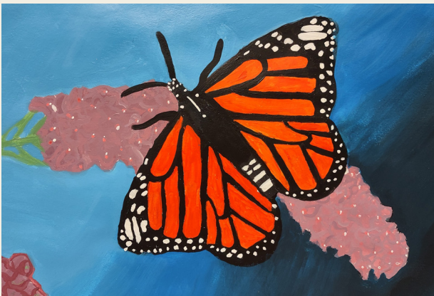
Mehri Qureshi, 9° grado • Escuela Secundaria Osbourn Park