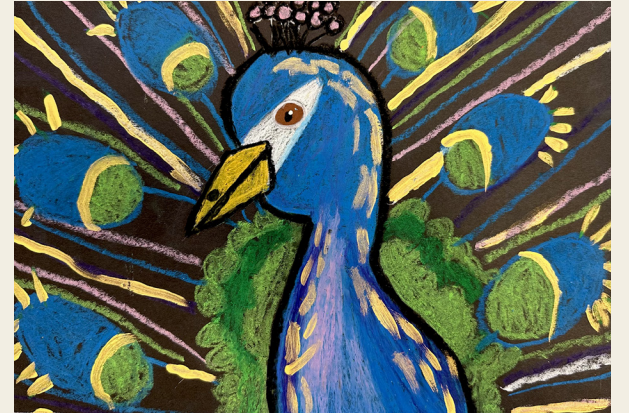
Declyn Ingram, 2° grado • Escuela The Nokesville