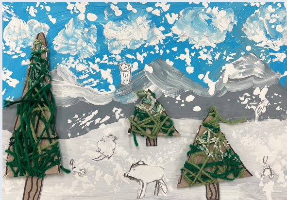
Jaelin Soulamany, Kindergarten • Escuela Primaria Pattie