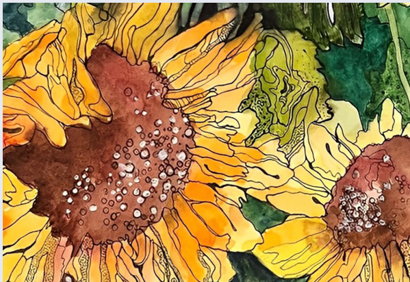
Rashda Choudhary, 12º grado • Escuela Secundaria Woodbridge